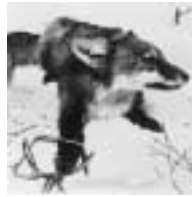
... piégé ...