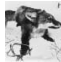
... piégé ...