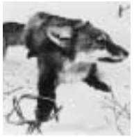
... piégé ...