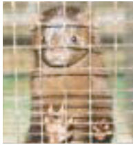
Mis en cage ...